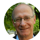
Père Gérard HEUDE

Chaque évêque, pendant la semaine sainte, célèbre dans sa cathédrale, la « messe chrismale ». Au cours de cette messe l'évêque bénit et consacre les huiles qui seront utilisées pour les sacrements, dans toutes les paroisses. Tous les chrétiens du diocèse sont invités à cette célébration. Pour nous, cette messe sera célébrée mardi 26 mars à 20h à la cathédrale.